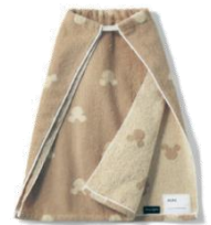
平ゴムを通す (平ゴムは8~10mm 幅がベストです。)